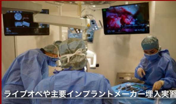
ライブオペや主要インプラントメーカー埋入実習