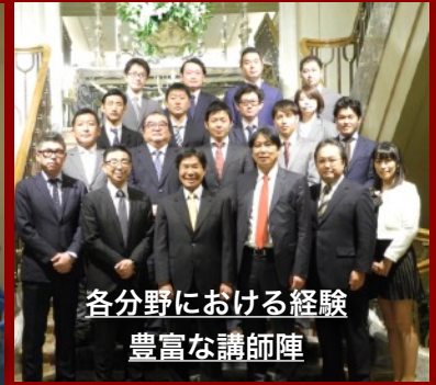
各分野における経験 豊富な講師陣