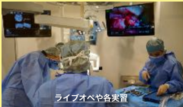
ライブオペや各実習