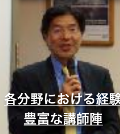
各分野における経験 豊富な講師陣