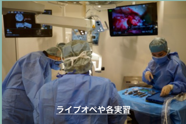
ライブオペや各実習