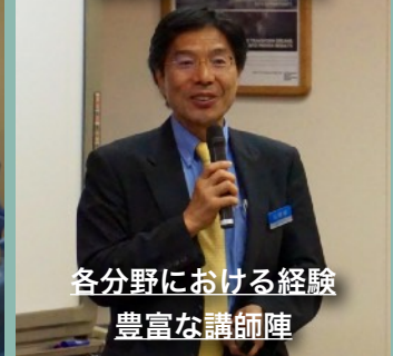
各分野における経験 豊富な講師陣